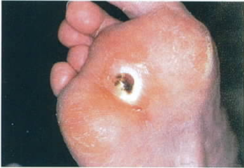
Een typisch neuropathisch ulcus: let op de witte eeltranden rondom de wond.

werden minder. De infectie werd minder en na 7 weken kon de antibiotica gestaakt worden. Op de nieuwe röntgenfoto, was te zien dat het ontstekingsproces tot stilstand was gekomen. Na 3 maanden was te zien dat er weer nieuwe botcellen werden gevormd.