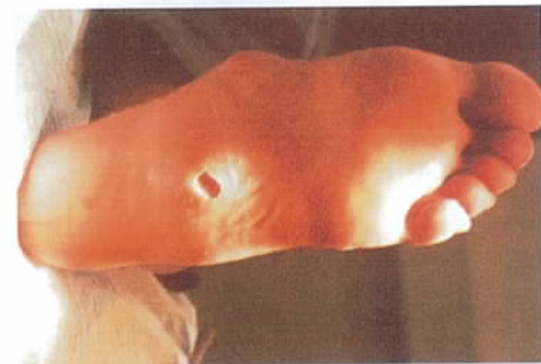
Een neuropathisch ulcus onder een charot voet.

De wondranden werden ontdaan van eelt. De teen werd drukvrij gelegd met behulp van een huidvriendelijke vilt.