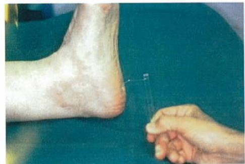
Het Semmes-Weinstein monofilament ter screening van de sensibele neuropathie

De behandeling bestond uit: Het direct starten met een hoge dosering antibiotica. Op de röntgenfoto bleek dat er een osteomyelitis aanwezig was in het IP gewricht.